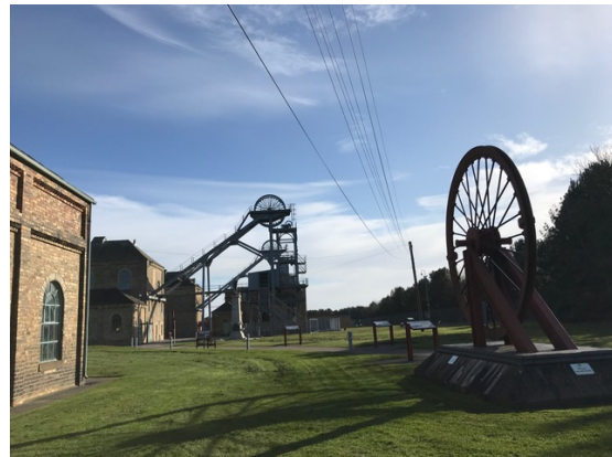
Woodhorn colliery museum

Title of the conference: ‘Prating of the Pit: Reading and Writing in the Northern Mining Districts’